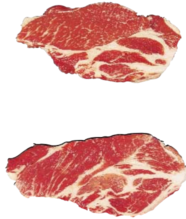
Shoulder Loin Chop, Boneless