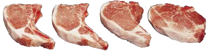
Center-Cut Loin Chop, Bone-In