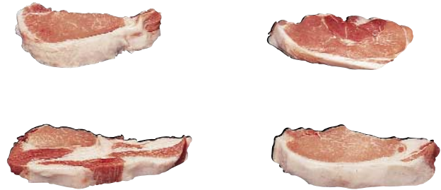
Center-Cut Loin Chop, Bone-In