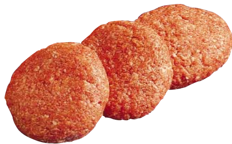
Ground Pork Patties