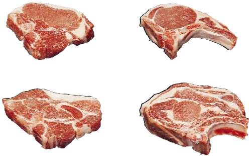
Pork Loin Chop, Bone-In